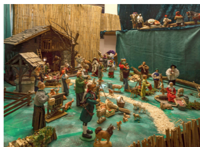
Krippe Hotel Münchner Hof